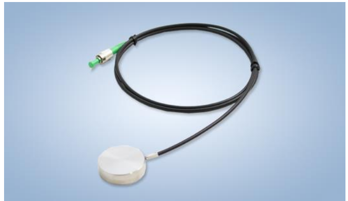
T810 表面式光栅温度传感器由 Technica 公司生产，获 UTC 和 Sylex 公司授权。

T810 系列表面式光栅温度传感器的制作采用了经授权，拥有专利的最先进的激光制作工艺和测温设计。产品资料里给出了最常用的参数配置，其他配置可订制。